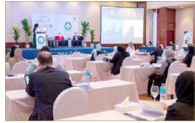
من فعاليات ختام مؤتمر أكاديمية البحرين للسمنة

فيما ستضمّن المرحلة الثانية تنظيم دورات تدريبية يحضرها المشتركين عبر الاتصال المرئي، ومن خلال الدراسة الذاتية، وسيحصلون في هذه المرحلة على 12 ساعة تدريبية أخرى، وتشمل المرحلة موضوعات تفاعلية عن أسس علاج وتقييم السمنة، وتعزيز المفاهيم التي تم تلقيها خلال المؤتمر. بعدها ينتقل المتدربون إلى المرحلة الثالثة والتي يستضيفها مستشفى الملك حمد الجامعي، وتحديداً عيادات السمنة المتخصصة، إذ سيتم استقبال المتخصصين الـ 45، ليتم تدريبهم وجهاً لوجه على طرق علاج وتقييم مرضى السمنة، وعرض عملي لطرق عملية توضيح أسس ممارسة التوجيه والإرشاد لمرضى السمنة، فيما ستتمتع تلك العوائل بالمرحلة الرابعة، والتي ستشهد تقييمها للتدريسيين، وفي حال اجتياز المرحلة سيحصلون على شهادات معتمدة من رئيس المجلس الأعلى للصحة رئيس جمعية السكيري البحرينية الفريق طبيب الشيخ محمد بن عبدالله آل خليفة ورئيس الكلية الملكية للجراحين بايرلندا مسير عتوم، توفيق إتمامهم لهذه الدورة التدريبية المتكاملة.