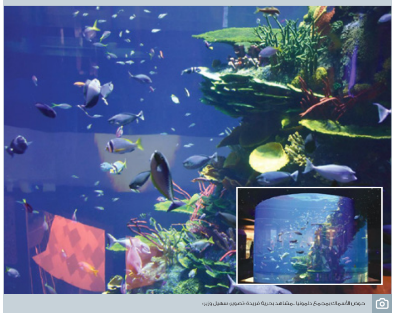
حوض الأسماك بمجمع دمونيا. منظر بحرية فريدة، تصوير: شهاب وزير