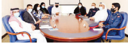
وكيل وزارة الداخلية خلال استقبال رئيس المؤسسة الوطنية لحقوق الإنسان.