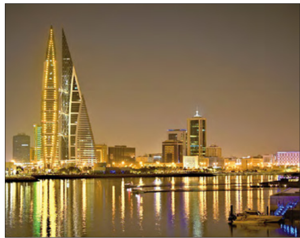
وزارة الصحة بملكة البحرين تشارك في الحملة العالمية بإضاءة مرفأ البحرين المالي وجمع مودا بول البحرين باللون البرتقالي، بدمرة من منظمة الصحة العالمية بمناسبة اليوم العالمي لسلامة المرضى والذي يصادف الجمعة 17 سبتمبر.

تمكنت شؤون الجمارك و بالتعاون مع الادارة العامة للمباحث الجنائية من إحباط محاولة تهريب حوالي 205429 حبة من الكبتاجون المخدرة، وذلك عبر منفذ الشحن الجوي، كانت حياضها في طرد خشن. وأوضحوا أنه أثناء قيام ضباط الجمارك بأداء الواجبات المنوطة بهم، انشبهوا في الطرد المذكور، وبيجراه التفتيش الدقيق له تم ضبط الحبوب المخدرة. وأشارت إلى أنه تم تحويل المادة المضبوطة إلى إدارة مكافحة المخدرات بالإدارة العامة للمباحث والأدلة الجنائية، لاتخاذ الإجراءات القانونية اللازمة. ومن جانبها صرحت الإدارة العامة للمباحث الجنائية أنه وبعد إجراء عمليات البحث والتحري عن وجهة المواد المخدرة التي تم ضبطها، تبين بأن الشحنة متجهة لأشخاص باهدي الدول الخليجية، حيث تم الاتصال والتنسيق مع الجهات الامنية هناك والقُبض عليهم.