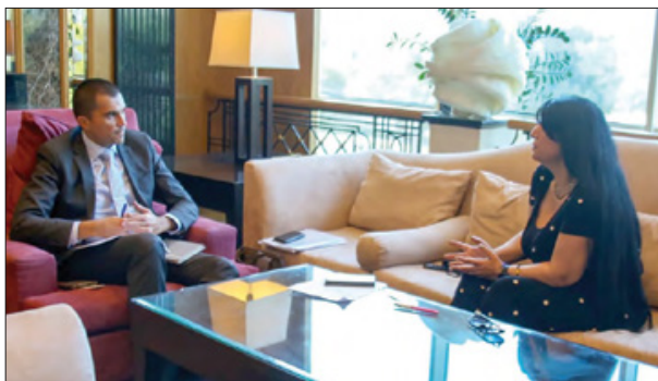
وزير السياحة القبرصي يتحدث لـ«الأيام»

أفسطس، نحن تقريبا استطعنا استعادة ما تصل نسبة 85% من عائدات السياحة في العام 2019، وتوقع بحلول نهاية هذا العام أن تصل إلى 50-45% لنفس العام (2019). ففي يوليو وانغسطس الماضيين كنا ثاني أفضل وجهة سياحية أوروبية بعد اليونان في أوروبا التي حققت 85% من عائدات السياحة المسجلة في العام 2019، ثم قبرص التي استعادت نحو 65% من عائدات السياحة المسجلة في العام (2019)، بالرغم من كل شيء، وبالرغم من صعوبة 18 شهرًا للماضية، ولكن في النصف الثاني من هذا العام كانت الأمور تسير بشكل جيد، وهذا مهم لنا لسببين، الأول استمرار حياة القطاع السياحي والثاني أن نتأكد من أن هذه ستكون محطة انطلاق لشيء أفضل في السنة القادمة، وأنا سعيد لأن عدد الأعمال التي وصلت إلى الإفلاس كان قليل جداً، بالطبع الحكومة القبرصية أنفقت الكثير في دعم البرنامج، وبالنسبة لي كوزير للسياحة فمن المهم جداً استمرار الأعمال، وعدم خروجها من السوق بسبب الجائحة، وإن تخرج قبرص من الجائحة بشكل مختلف تماماً، وبإقل الخسائر، هذا امر رائع.